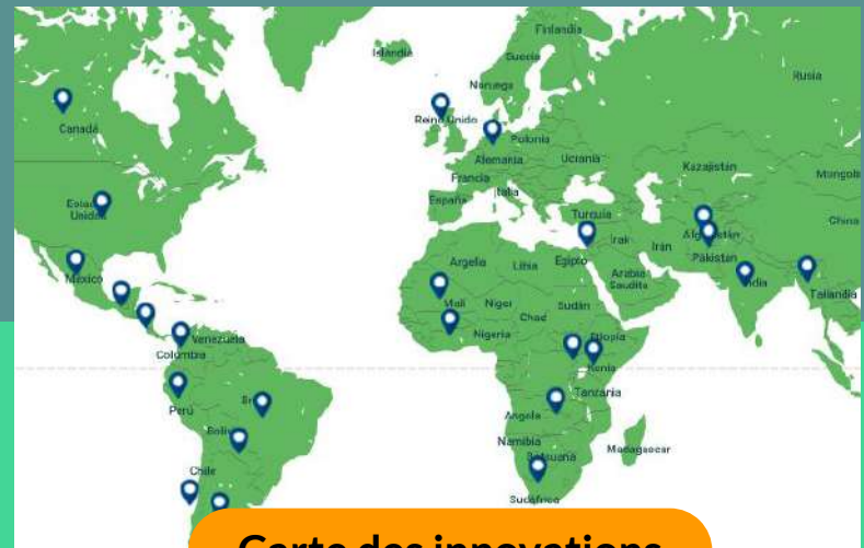
Carte des innovations

SUMMA met à disposition la plateforme en ligne des pratiques scolaires efficaces, qui vise à présenter des preuves solides de l'efficacité (coût et impact sur l'apprentissage) de différentes stratégies et interventions éducatives, et à mieux soutenir les décideurs politiques, les enseignants et les autres acteurs clés de la communauté scolaire en les aidant à concentrer leurs efforts sur les pratiques dont l'efficacité a été démontrée par des preuves scientifiques provenant du monde entier.